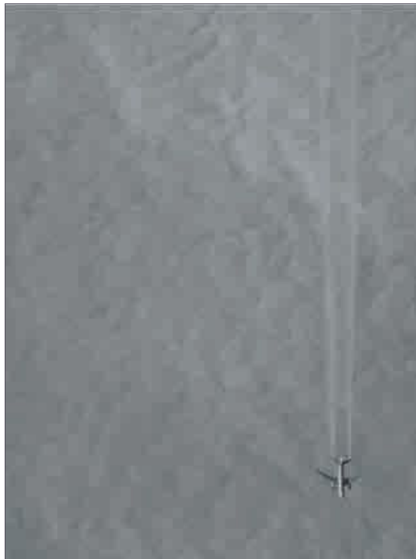
STREKEN: Sandbergs fotografier peker utover det forgjengelige og er bærere

Fotografiene på utstillingen oppleves som intense enkeltverk for betrakteren. Bildene gir et inntrykk av en kunstner som var besatt av sine ideer. Med det samme han