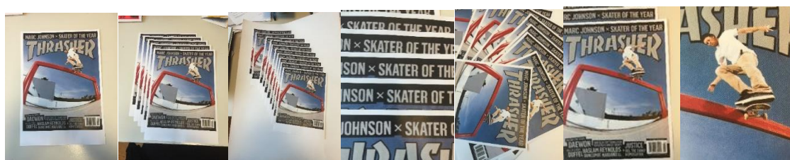
Stillbilder fra video

Inspirert av Faldbakkens benyttelse av overlappende bilder som kan minne om skjermbilder, skal vi arbeide med en oppgave med utgangspunkt i en app som danner en timelaps. Elevene skal arbeide med utgangspunkt i 10 identiske bilder fra magasinforsider til blader om subkulturer som skating, metall-musikk, tattoo og surfing. Disse bildene danner grunnlag for øvelser i komposisjon og visuell utforskning da elevene skal fotografere overlappingen av bildene og zoome inn på detaljer fra magasinet som ender med et abstrakt uttrykk. Appen samler bildene til en video som skal presenteres i fellesskap. Elevene låner iPoder her på museet.