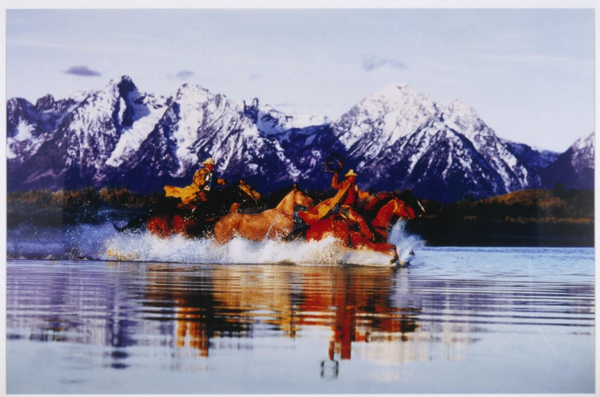
Richard Prince, Untitled (Cowboys) , 1997

I dag er massemedia en selvfølgelig og naturlig del av vår virkelighetsoppfattelse og har en enorm påvirkningskraft på vårt selvbilde. Dette ble utforsket av en gruppe kunstnere som ofte omtales som The Pictures Generation hvor kunstnere som Cindy Sherman, Richard Prince og Sherrie Levine er del av. Felles for disse kunstnerne er en undersøkelse av massemediens bildestrøm samt dens estetikk og påvirkningskraft på mennesket. Richard Prince avfotograferte eksisterende bilder fra magasiner og reklamer og presenterte de som kunstverk. I serien Untitled (Cowboys) kan man se den ikoniske Marlboro-mannen som igjen bygger på mytologien om Den ville Vesten og macho kultur.