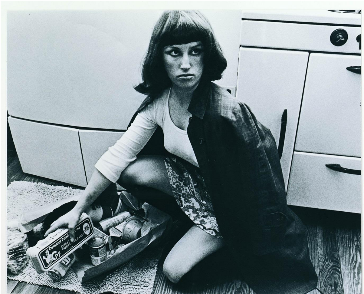
Cindy Sherman, Untitled Film Stills #10, 1978