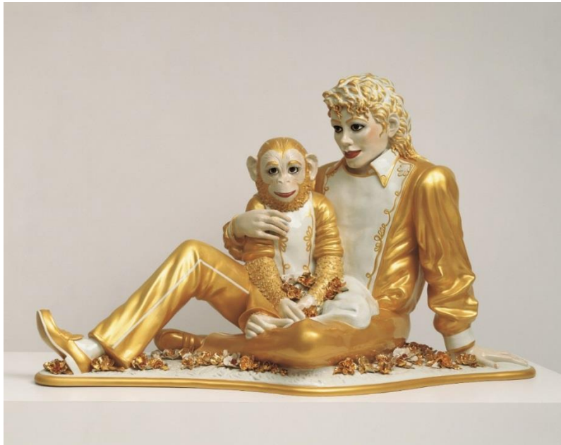
Jeff Koons, Michael Jackson and Bubbles 1988

Vi inviterer til en omvisning hvor vi ser på hvordan ulike samtidskunstnere utforsker populærkultur fra 1960-tallet til i dag. I dag har massemedier en enorm påvirkningskraft på barn og ungdoms virkelighetsoppfattelse med en konstant billedstrøm fra TV, reklame, sosiale medier og internett. Flere av kunstnerne vi skal bli kjent med har et kritisk blikk på populærkulturen som kan gi elevene et mer reflektert forhold til de ulike massemediene.