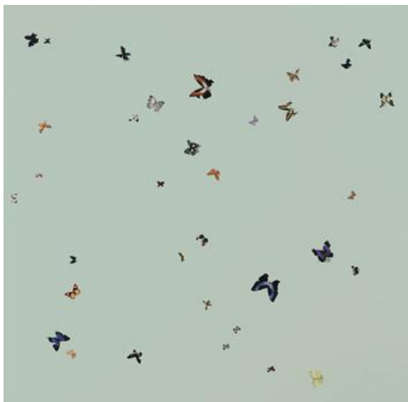
Foto: Photographed by Stephen White © Damien Hirst and Science Ltd. All rights reserved, DACS 2015

Maleriet «I Feel Love» viser et monokromt glansmalt lerret med 35 sommerfugler som er tilfeldig plassert utover lerretet. Det er noe vakkert over motivet, en anelse av ro og frihet som understrekes av sommerfuglenes naturlige fargespill og den turkise bakgrunnsfargen. Verkets tittel, «I Feel Love», gir videre positive assosiasjoner med referansen til kjærlighet. Maleriet er en del av Damien Hirsts serie Butterfly Colour Paintings , og disse sommerfuglmaleriene er