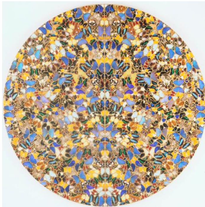
Eulogy, 2008.

Damien Hirst, født i Bristol, Storbritannia, i 1965, er allment anerkjent som en av de mest innflytelsesrike kunstnerne i sin generasjon. Hirst har en spesiell posisjon i Astrup Fearnley Museet, som er stolte over å ha en betydelig samling av hans arbeider. Det startet med ervervelsen av Mother and Child (Divided) (1993) i 1996, og i denne utstillingen vises alle museets verk av Hirst for første gang samlet; sammen med et av kunstnerens mest ikoniske verk: diamanthodeskallen, For the Love of God (2007).