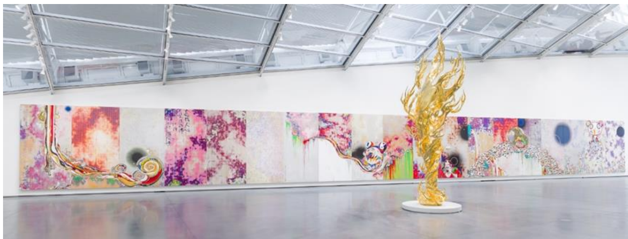
Takashi Murakami, 727 - 272: <Emergence of God at the Reversal of Fate> , 2006 – 2009