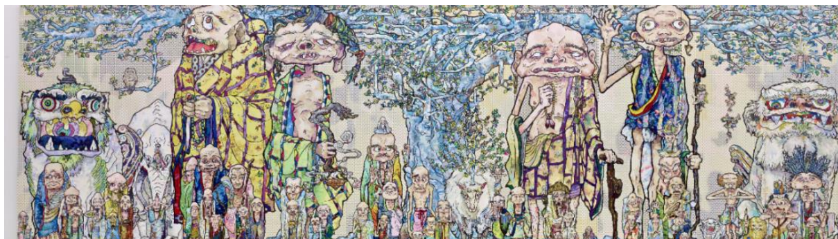
Takashi Murakami, 69 Arhats Beneath the Bodhi Tree , 2013

Dette ti meter lange verket er utstillingens største arhat-maleri. Det fremstiller 69 ulike arhater og flere kan identifiseres som medlemmer av en gruppe kalt De 16 Arhatene. Disse er disipler av Buddha som har en unik betydning som moralske forbilder innen Zen-buddhismen. Det store Bodhi-treet er sentralt i beretninger om Buddhas åndelige oppvåkning, som skal ha oppstått under et slikt tre. Blant arhatene finner vi flere dyr og fabeldyr som har symbolske betydninger i buddhistisk tradisjon, som de kinesiske løvene eller den hvite tigreren. Som en gruppe kan dyrene og arhatene tolkes som et håp om naturens gjenfødelse og helbredelse etter jordskjelvet og Fukushima-ulykken i 2011 ved å fremme et nøkternt og moralsk buddhistisk tankesett.